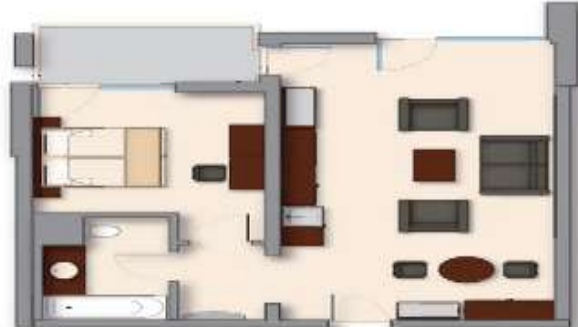
Apartment sa 2 sobe (max 3adl ili 2adl+2chd do 13,99g)