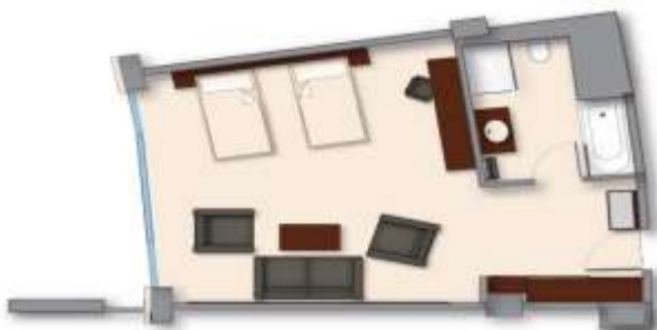
Junior suite (max. 3adl ili 2adl+2chd do 13,99g)