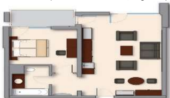
Apartment sa 2 sobe (max 3adl ili 2adl+2chd do 13,99g)